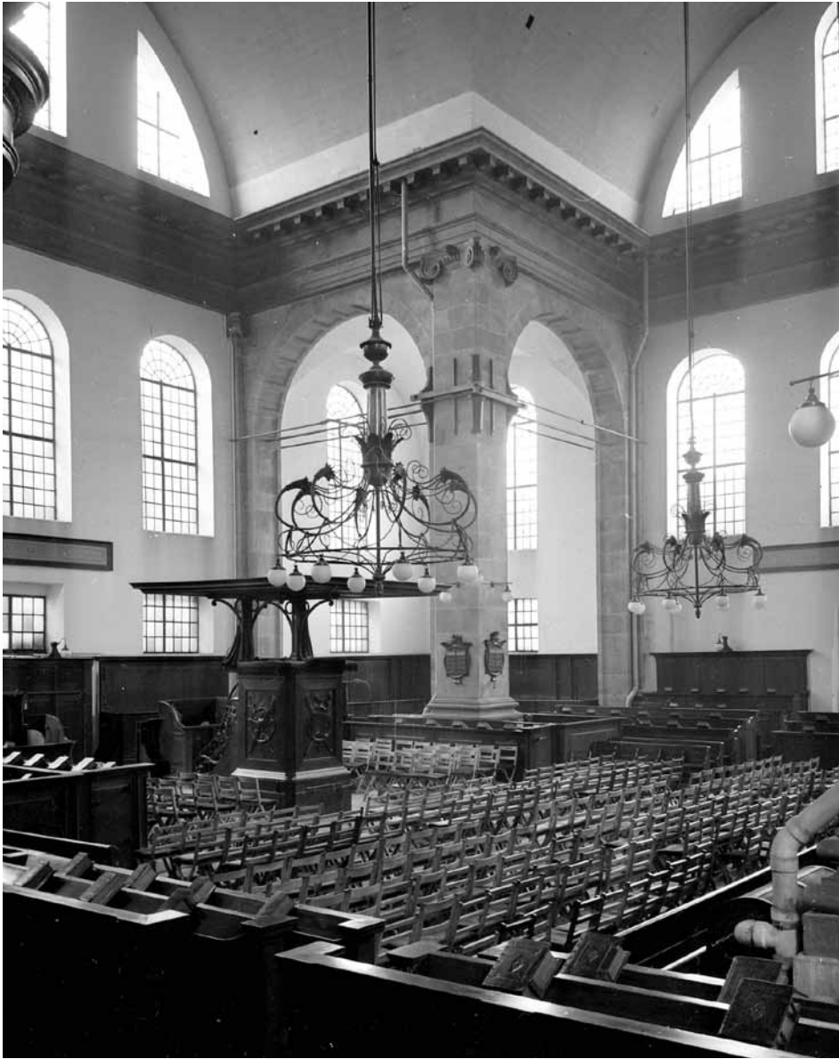
Interieur van de Oosterkerk, circa 1960

De vloer bleef ook daarna verzakken. Het opheffen van individuele zerken keert regelmatig terug in de notulen van de bouwcommissie. In 1931 vond laatste ophoging van de vloer plaats. Ook het orgel bleek sterk naar voren over te hellen, zodat de bouwcommissie in 1933 besloot dit op te vijzelen en van een nieuwe steunconstructie te voorzien. Dat ging wel ten koste van de vier fraaie gegalvaniseerde ijzeren kolommen van de firma Zimmer, die plaatsmaakten voor zes met hout beklede ijzeren balken. Bij de jongste restauratie zijn twee van deze stijlen verwijderd.