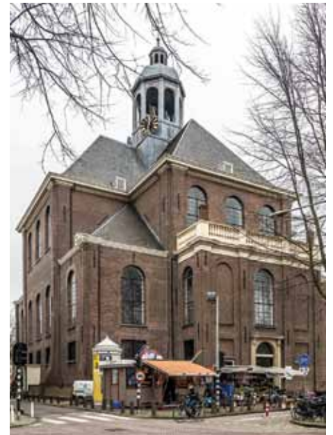
Gevel van de Oosterkerk aan de Oostenburgergracht Links: De preekstoel van de Oosterkerk.